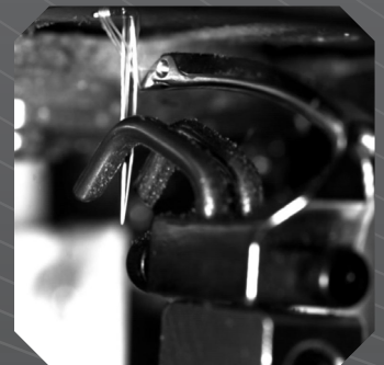
Industrie: Dynamik von Textilmaschinen