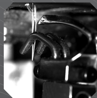
Industrie: Dynamik von Textilmaschinen